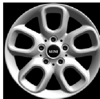
Styling 494 Loop Spoke