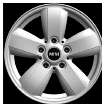
Styling 492 Helispoke

Felge und Winterkomplettad sind nicht in Verbindung mit 17“ JCW Bremse zu verwenden.