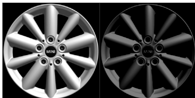
Styling 508 in Bright Silver Metallic und Jet Black Uni Abbildung entspricht noch nicht finalem Serienstand.