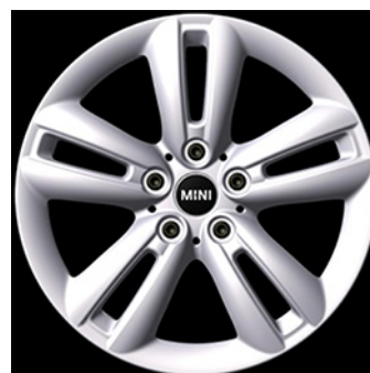
Styling 501 JCW Track Spoke