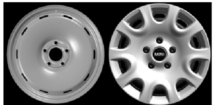
Styling 12, Stahlrad/Radvollblende

Felge und Winterkomplettad sind nicht in Verbindung mit 17“ JCW Bremse zu verwenden.